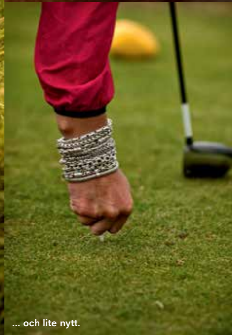
... och lite nytt.