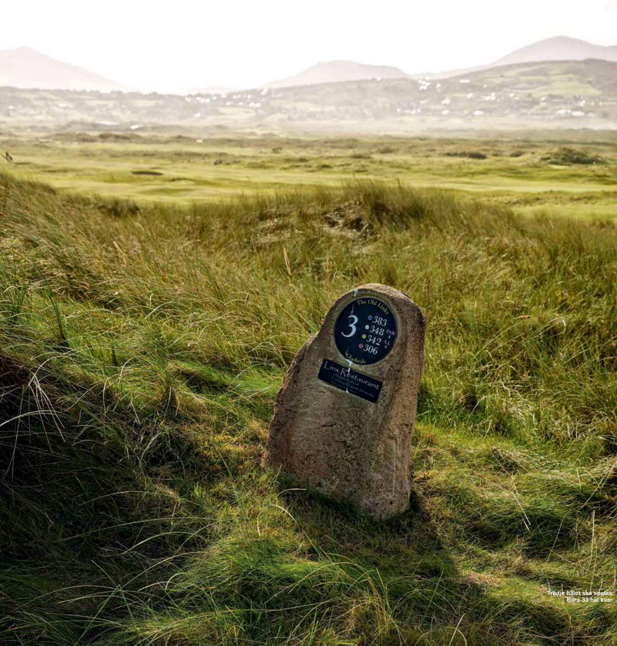
Tredje hålet ska spelas. Bara 33 hål kvar.