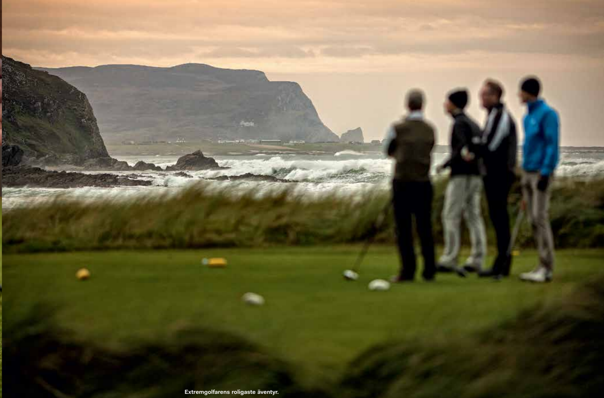
Extremgolfarens roligaste äventyr.

”Jag gillar ju bollar, och golfen blev den perfekta grejen för mig. Nu när jag kan vara här och spela två av världens roligaste golfbanor är det egentligen som en dröm. Även om det är svårt ibland. Ganska ofta, förresten. Alltid. Det blåste också hårt en gång i Waterville – men idag var det tuffare. Jag slog en järnnia i medvinden, hade 180 meter kvar men slog den för långt. På nästa hål, i motvind, slog jag en järnnatta som flög 80 meter. Till slut har man inte en susning om vad man ska göra. Inte en siffra blir rätt.”