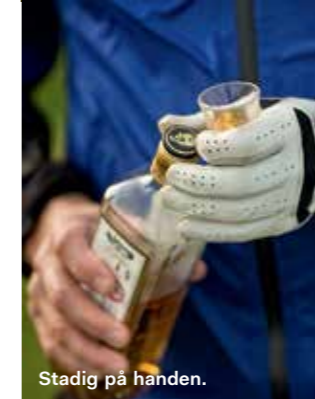
Stadig på handen.