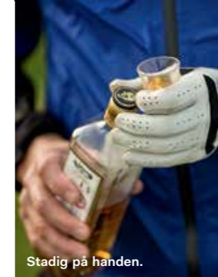
Stadig på handen.